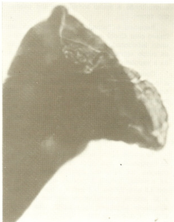
Fig. 6 — Bolsa copuladora do Syngamus laryngeus (macho).