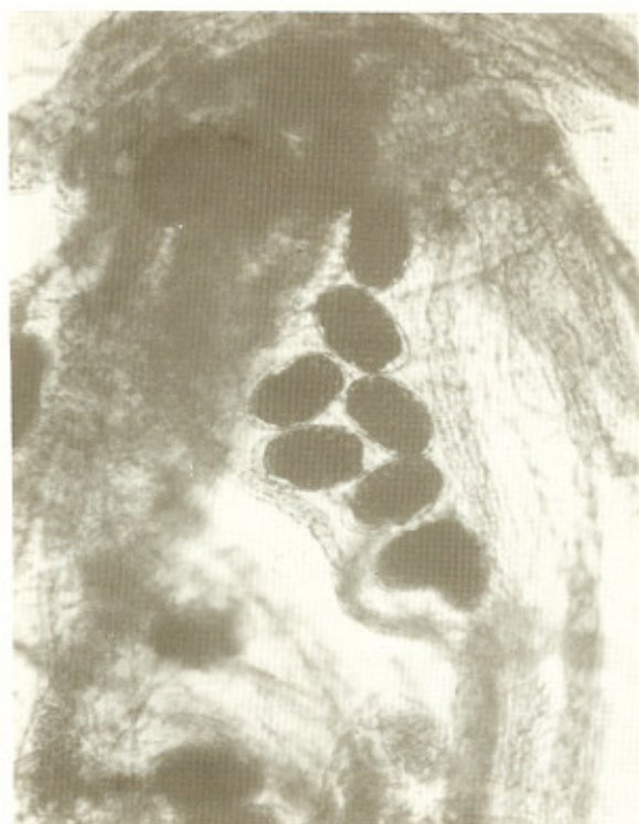
Fig. 4 — Ovos de Syngamus laryngeus .