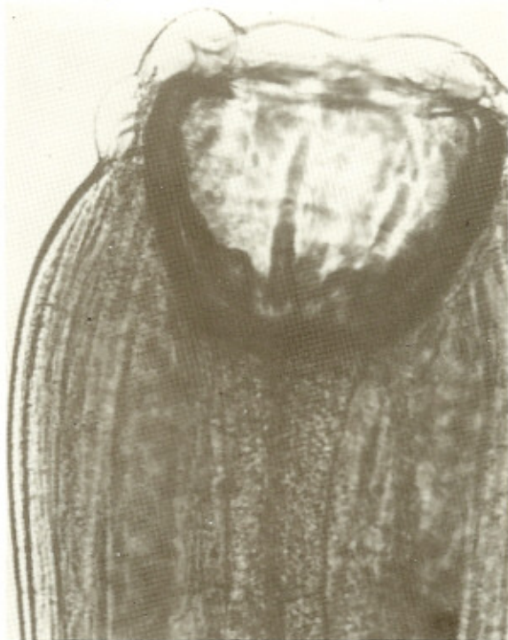
Fig. 2 — Extremidade anterior (cápsula bucal) do Syngamus laryngeus (macho).