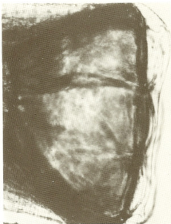
Fig. 3 — Extremidade anterior (cápsula bucal) do Syngamus laryngeus (fêmea).