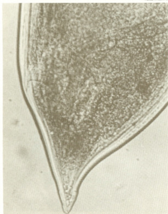
Fig. 5 — Extremidade posterior (cauda) do Syngamus laryngeus (fêmea).